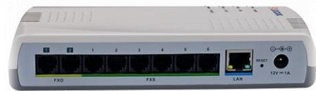
IP PBX Slican ITS